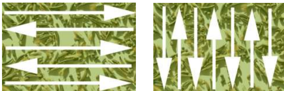
Figure 2. Schéma d'application des semences en deux étapes.

Pour assurer une distribution uniforme des semences, diviser la quantité du mélange de semences en deux. Si le site a été marqué en plusieurs sections, diviser aussi les semences pour chacune des sections en deux. Semer la première moitié du mélange en parcourant le site ou la section dans un sens seulement, par exemple d'est en ouest. Semer ensuite la seconde moitié du mélange en parcourant le site ou la section perpendiculairement au premier parcours, par exemple du nord au sud (voir figure 2.). Il faut garder à l'esprit que les semences doivent être distribuées uniformément sur l'ensemble du site. Normalement, la quantité de semences apportées sur le site devrait avoir été calculée au préalable et correspondre aux besoins du site. Il faut donc doser l'épandage des semences en conséquence.